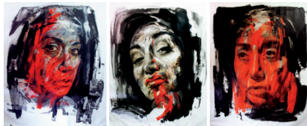
Self Portrait , ulje na platnu, 185 x 210 cm, 2022.