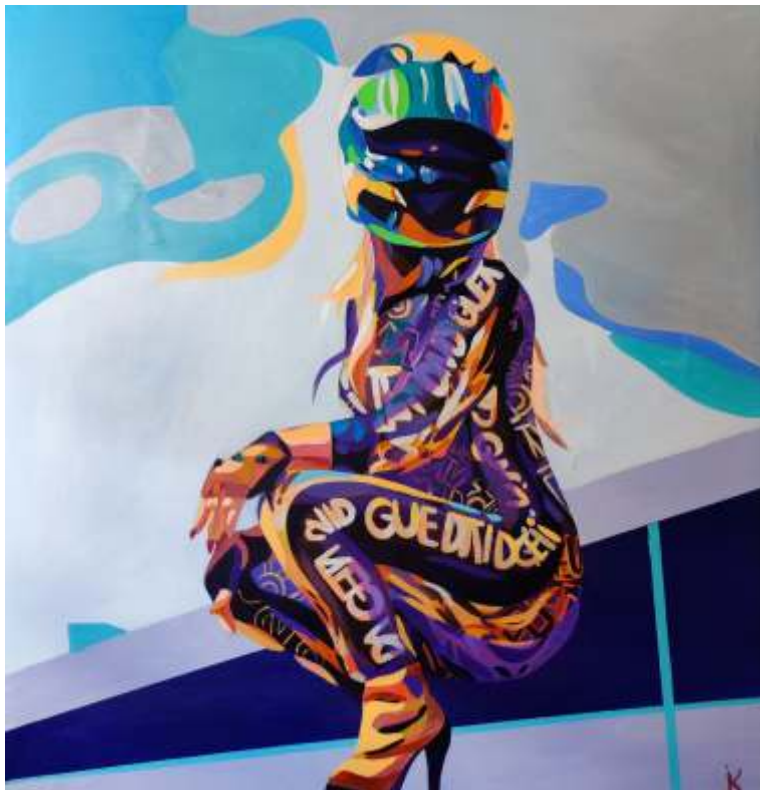
Kopp Ivan, Dangerous, akril, 1x1 m, 2024.