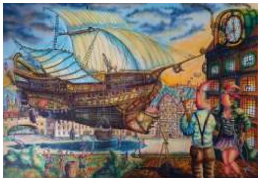
Kiski Bojan, Prvi let Taivasa, kombinirana tehnika, 70x50, 2023.