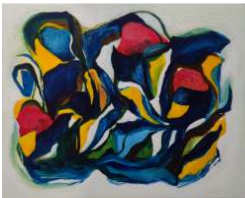
Jukić Koraljka, Gibanja, akril na platnu, 40 x 50 cm, 2024.