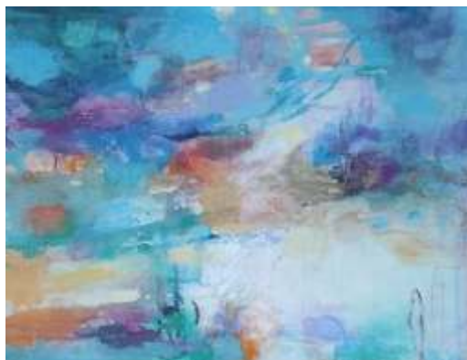
Družeta Ingrid, U moru, akril, 40x50, 2024.