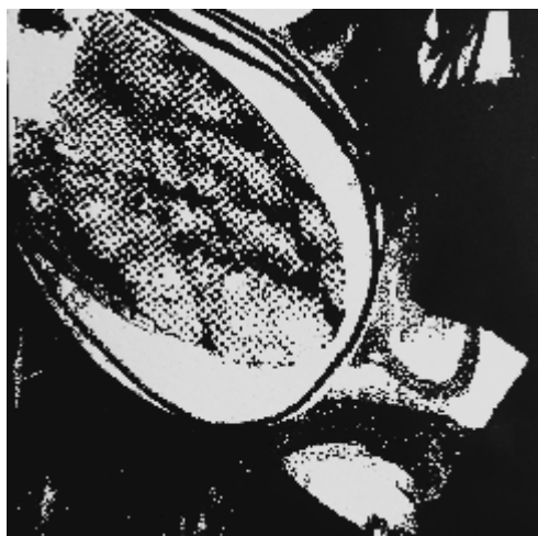
Tomičić Ksenija, Ex naturae VIII, linorez, 80,5X70 2024.