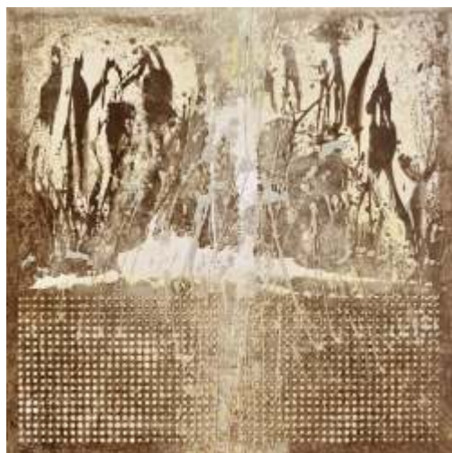
Milić Mladen, Istarski krajolik 2, kombinirana tehnika na platnu 90x90 cm, 2023.