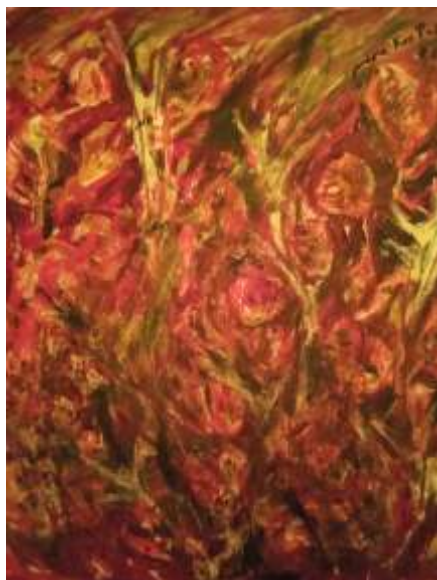
Kos Paliska Vera, Požar u vrtu, ulje na platnu, 50x50 cm, 2024.