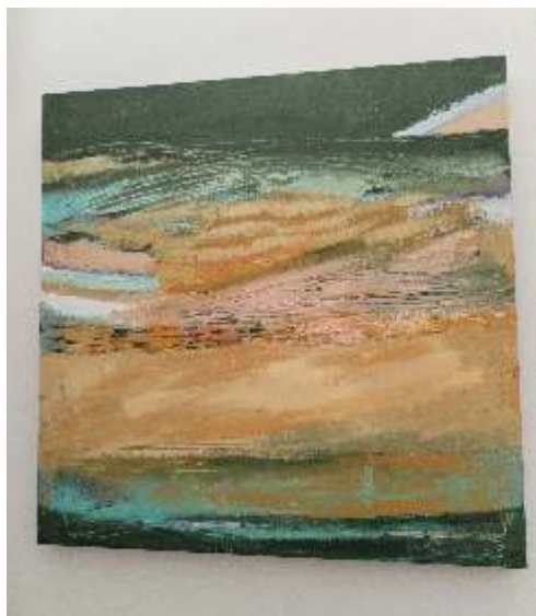
Simeunović Bajec Sanja, Nevera, akril na platnu, 70x70 cm, 2024.