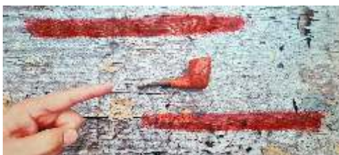
Nikolac Ivica, Hipnagogične varke slika (misterij objekta s naočitim detaljima) kombinirana tehnika u boji, akrilne boje, 35x52, 2024.