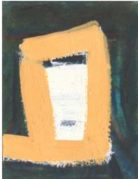
Gustini Igor, IQ, akrilik na kaširanom platnu, 22x28 cm, 2018.