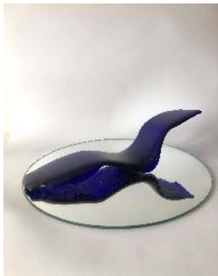
Barković Ljiljana, Plavi odraz, toplinska obrada stakla, 31x9 cm, 2024.