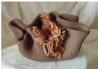
Ostić Jadranka, G-II, terracotta, 22x15x13 cm, 2024.