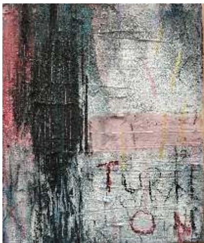
Zanini Matilda, Scrabble, kombinirana tehnika na platnu, 25x30 cm, triptih, 2024.