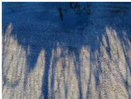
Tomašević Dančević Mirjana, Zastati u hodu - isječak 1-3, fotografija, triptih, 122x30 cm, 2024.