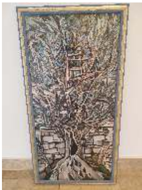
Rudan Milena, Istraživanja, ulje na lesonitu, 100x50 cm, 2022.