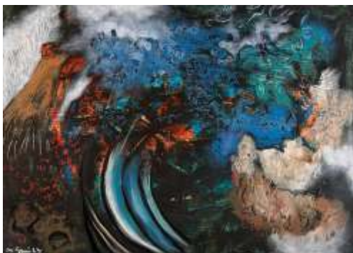
Gaertner Heda, More i kamenčići, kombinirana tehnika, 70x50, 2023.