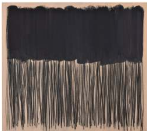
Bičić Tea, Kiša karbona, akril i ugljen na platnu, 80x90 cm, 2019.