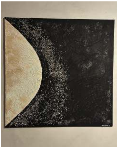
Dlaka Sara, Mjesečina, kombinirana tehnika, 100x100 cm, 2024.