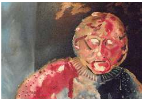
Rotar Aleksandra, Iz druge dimenzije, ulje na platnu, 70x100 cm, 2016.