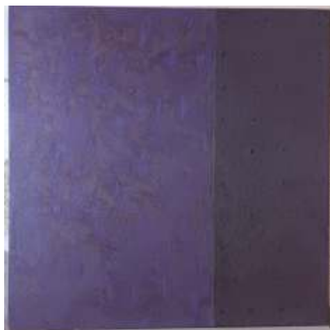
Ražov Nikola, Iz ciklusa Istarske fasade, 100x100 cm, ulje i pijesak na platnu, 2015.