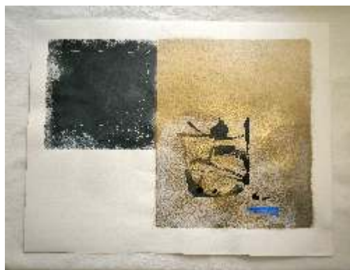
Luketić Lada, Gestualnost, kombinirana tehnika, 50×65 cm, 2023.