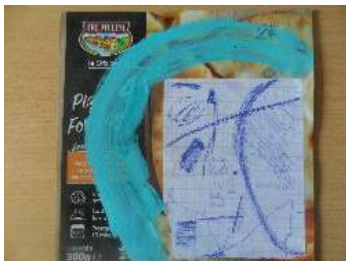
Zbašnik Andrej, Slikomir, kombinirana tehnika, 28x28 cm, 2024.