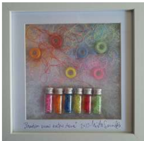
Savani Profeta Mirta, Pamtim samo sretne dane, kombinirana tehnika-assamblage, 22,5x22,5 cm, 2024.