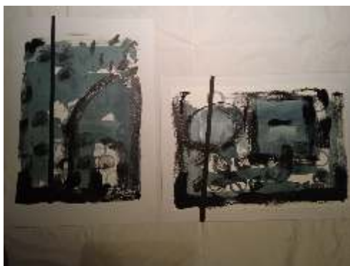
Legović Branka, Voda, akril na papiru, 35x50 cm, diptih, 2023.