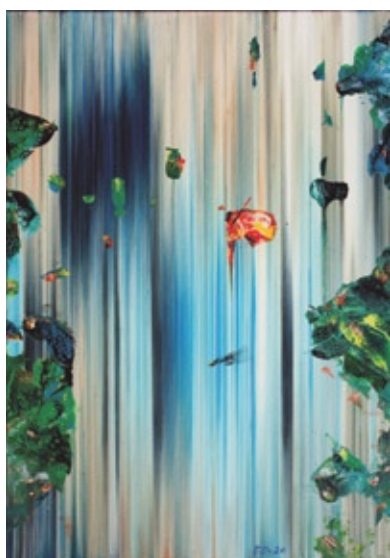
FL-03, akril na platnu, 2020, 100x70 cm, AR