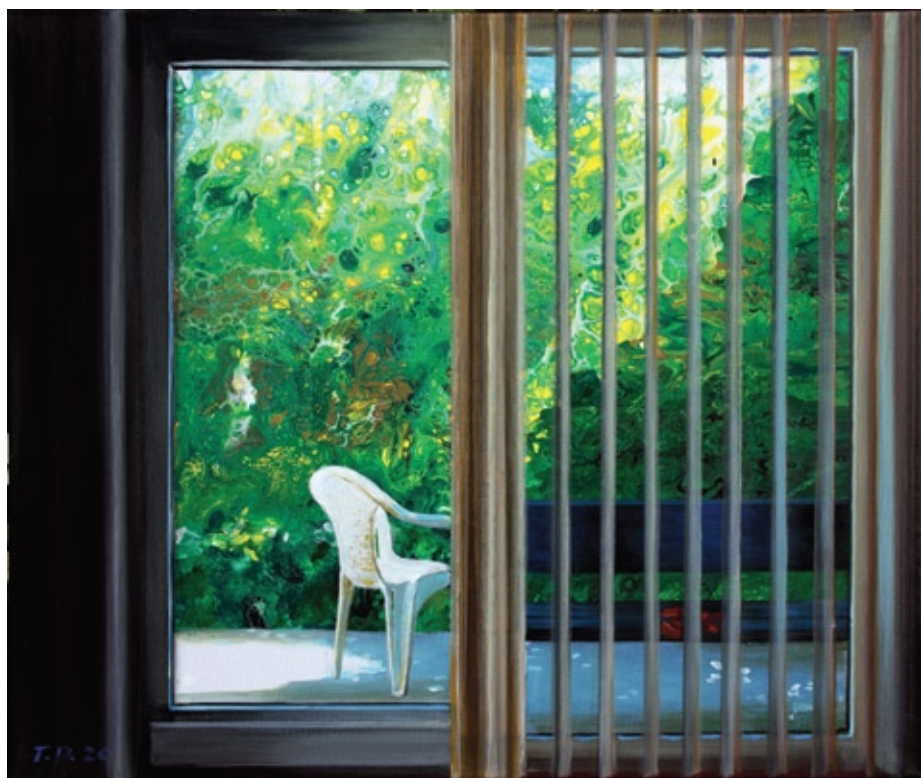
FL-11, akril na platnu, 2020, 50x60 cm

na način, da određenu sliku možemo pogledati kroz foto objektiv mobilnog uređaja spojenog na za to određenu aplikaciju te u slici vidjeti i "njenu proširenu stvarnost", tj. video animaciju koja motiv na slici u stvari pretvara u pokret te ga postavlja u potpuno novi kontekst. U praksi su to vrlo dinamične, kratke animacije pojedinih motiva i tim efektom, statična slika doslovno postaje dinamična na licu mjesta, poput kratkog filma. Uzevši u obzir cjelokupnu simboliku ciklusa Fake lights, ova nas proširena stvarnost slike, odvodi u potpuno novi fiktivni svijet, naizgled još bliži i vjerniji našem stvarnom svijetu i dodatno naglašava cjelokupni paradoks naše lakovjernosti u poimanju lažne realnosti, pogotovo putem vizualnih podražaja.