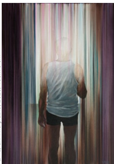
FL-12, akril na platnu, 2020, 100x70 cm