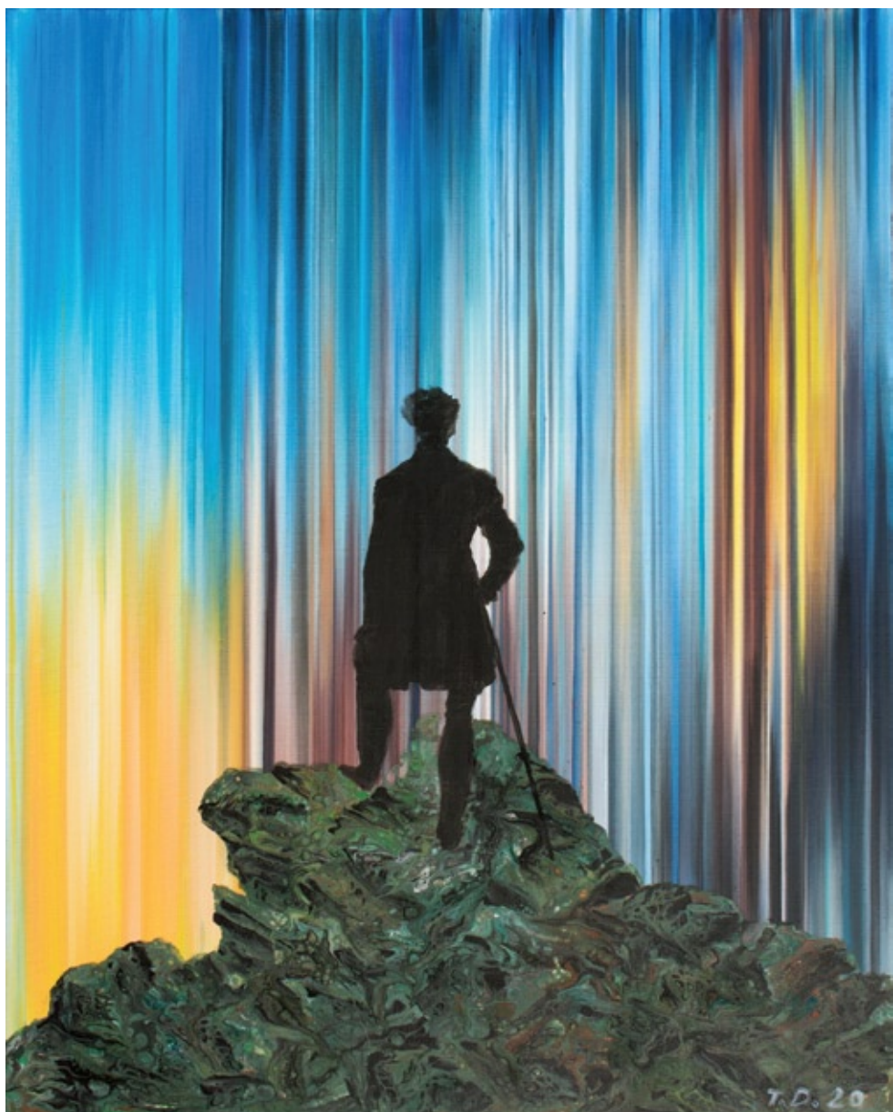
FL-01, akril na platnu, 2020, 100x80 cm

gurno daje slika FL-01 koja reinterpreтира poznatu sliku Lutalica iznad mora magle iz 1818., jednog od vodećih slikara romantizma, Caspara Davida Friedricha, na kojoj vidimo čovjeka, koji stoji na vrhu planine obavijene maglom u podnožju, dok simbolika slike postaje sinonimom romantičarskog poimanja svijeta: bijeg od stvarnosti, neizvjesnost, dominacija čovjeka nad prirodom, a istovremeno i njegova nebitnost, u ulozu malog čovjeka naspram moćne prirode. Vrlo suvremeno i aktualno stanje, uzevši u obzir da čovjek na slici predstavlja metaforu nepoznate budućnosti, kao i kod C.D. Friedricha prije 200 godina.