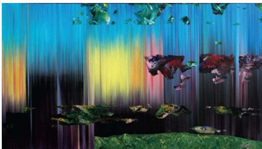
FL-07, akril na platnu, 2020, 70x124 cm, AR