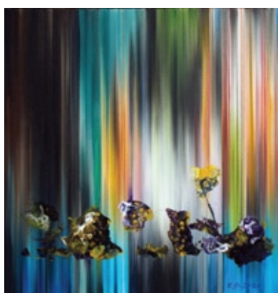
FL-05 stell life, akril na platnu, 2020, 70x70 cm