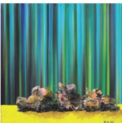
FL-06 stell life, akril na platnu, 2020, 70x70 cm